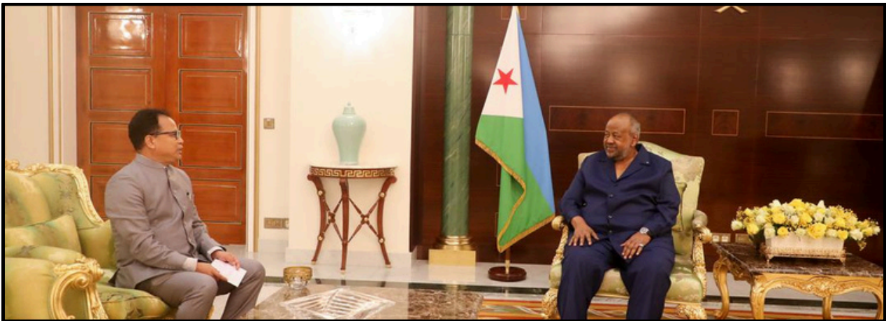
Photo 1 : Ambassadrice du Royaume des Pays-Bas remettant ses lettres au Président de la République.