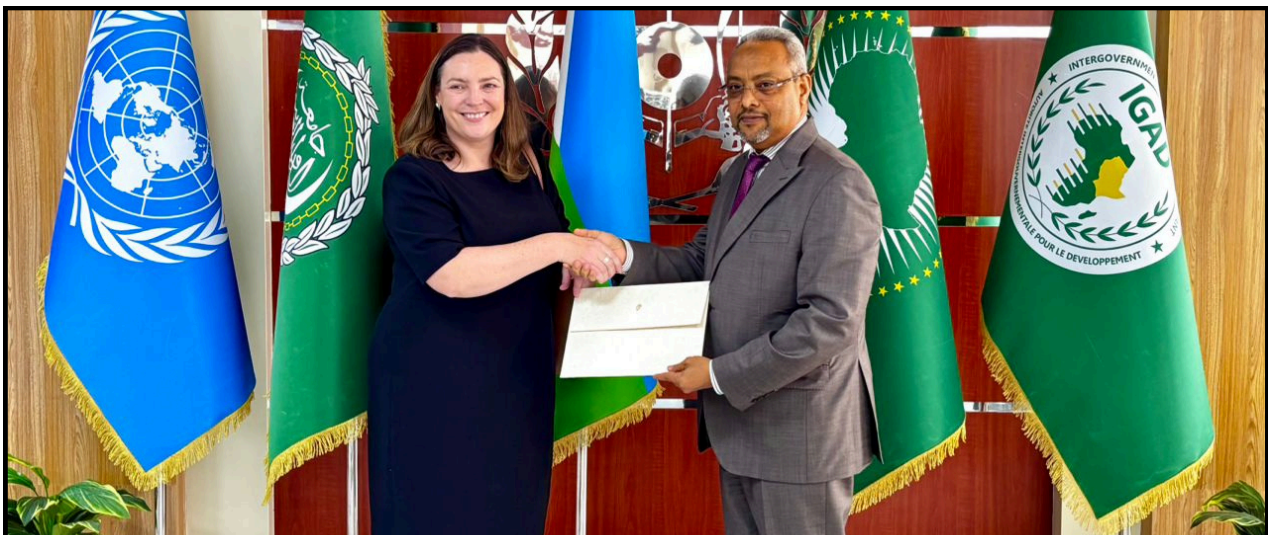
Photo : Ambassadrice de l'Irlande, remettant ses copies figurées au Ministre des Affaires Etrangères et de la Coopération Internationale.

Le véhicule du Protocole récupère l'ambassadeur à l'hôtel, conformément au programme établi, pour le conduire au Ministère des Affaires étrangères et de la Coopération internationale (MAECI). Là, il est introduit auprès du Ministre pour la remise des copies figurées. Cette étape protocolaire, qui ne fait pas appel à une escorte ni à une garde d'honneur, et durant laquelle le drapeau n'est pas apposé sur le véhicule, dure environ 15 minutes.