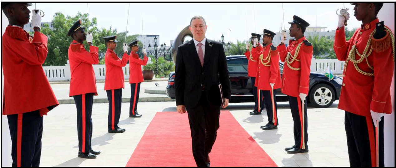
Photo : Ambassadeur de la République d'Azerbaïdjan, entrant dans le Palais Présidentiel.

Lors de la présentation des Lettres de Créance au Président de la République, Chef du Gouvernement, un conseiller du Protocole d'État se rend au lieu de résidence de l'ambassadeur désigné (hôtel ou résidence). Il l'invite à prendre place à l'arrière côté droit de la voiture du Protocole d'État, tandis que lui-même prend place côté gauche. Avant le départ, le conseiller vérifie que l'ambassadeur ait bien les Lettres de Créance sur lui.