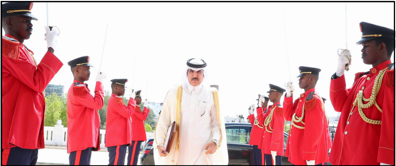
سفير دولة قطر يمر بين صفوف حرس الشرف متجها نحو مدخل القصر الجمهوري

في يوم تقديم أوراق الاعتماد إلى فخامة رئيس الجمهورية، يتوجه مندوب البروتوكول إلى مقر إقامة السفير (الفندق أو الإقامة الرسمية) ويُرافقه في سيارة رسمية، حيث يجلس السفير في المقعد الخلفي الأيمن، بينما يجلس المندوب إلى يساره. وقبل الانطلاق، يتأكد المندوب من أن السفير يحمل النسخة الأصلية من أوراق اعتماده.